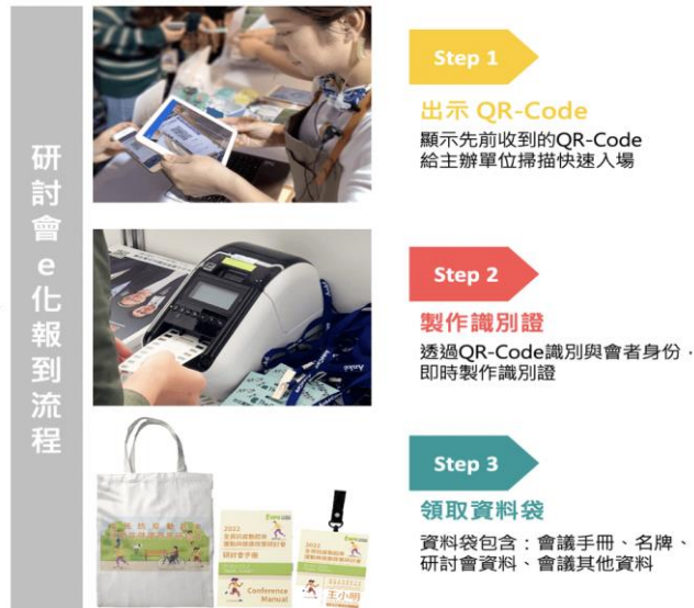
圖 3、研討會 e 化報到流程示意圖