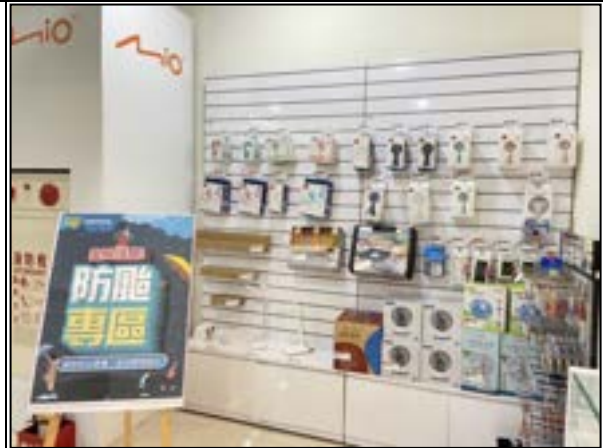
圖 6、賣場專區宣導照片(防颱用品)