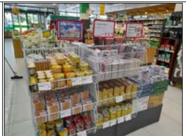
圖 14、賣場專區照片(防災儲備)