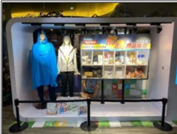
圖 3、賣場專區照片(防颱用品)