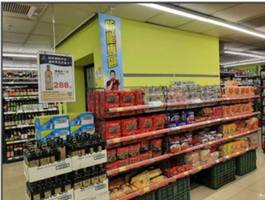
圖 8、賣場專區照片(防災儲備)