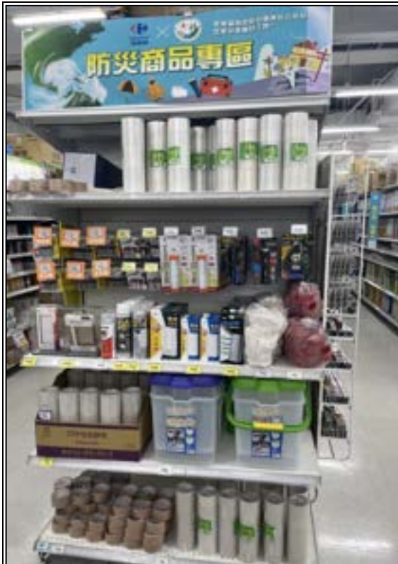
圖 24、賣場專區(防災商品)