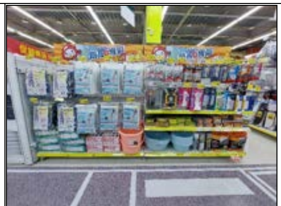
圖 16、賣場專區照片(防災儲備)