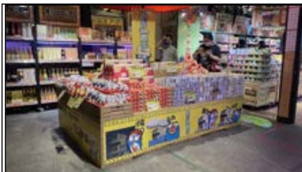
圖 9、賣場專區照片(防災儲備)