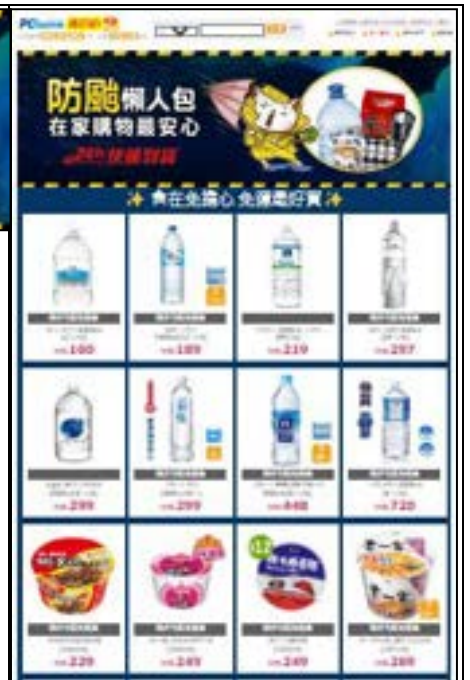
圖 28、產品目錄及宣導單