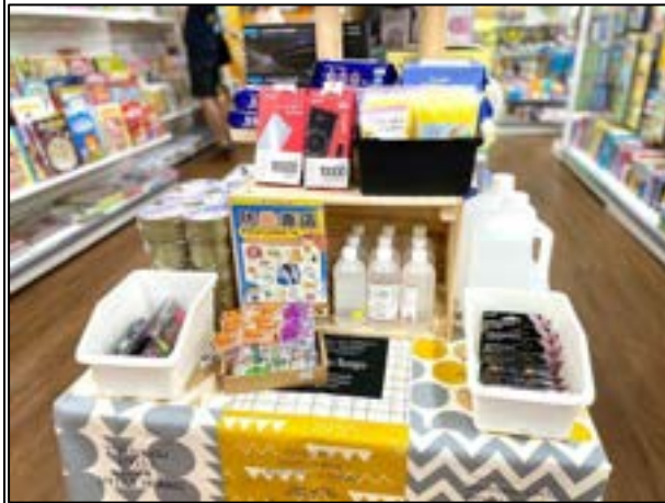
圖 1、賣場專區照片(防颱用品)