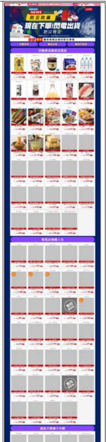
圖 34、產品目錄及宣導單