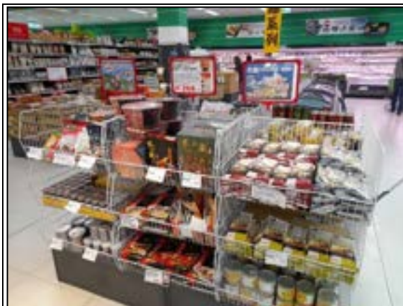
圖 13、賣場專區照片(防災儲備)