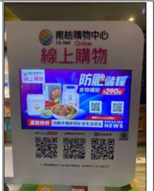
圖 4、賣場專區照片(防災儲備)