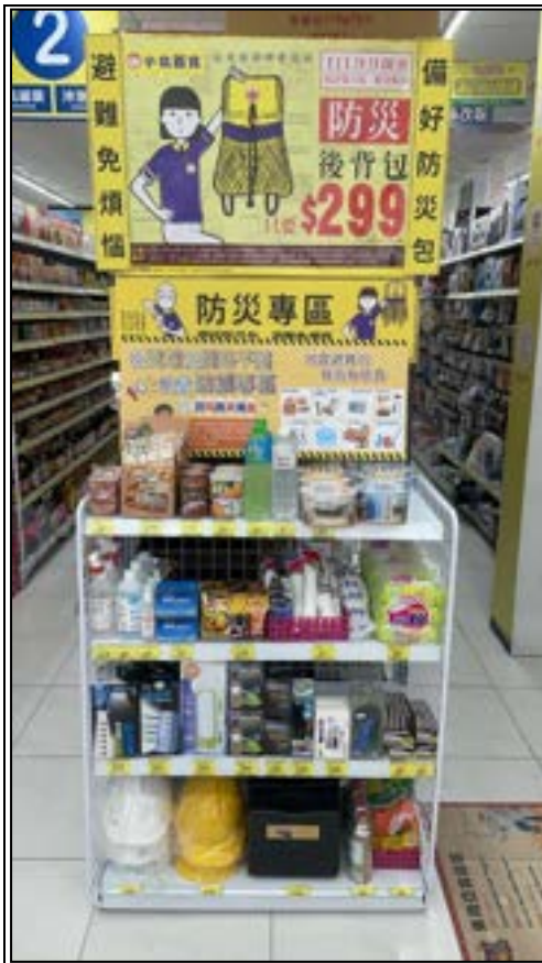
圖 22、賣場專區(防災用品)