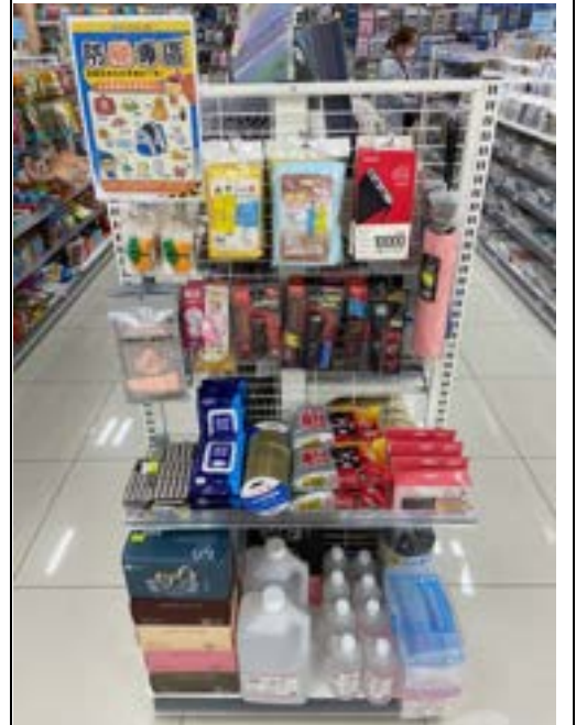
圖 2、賣場專區照片(防颱用品)