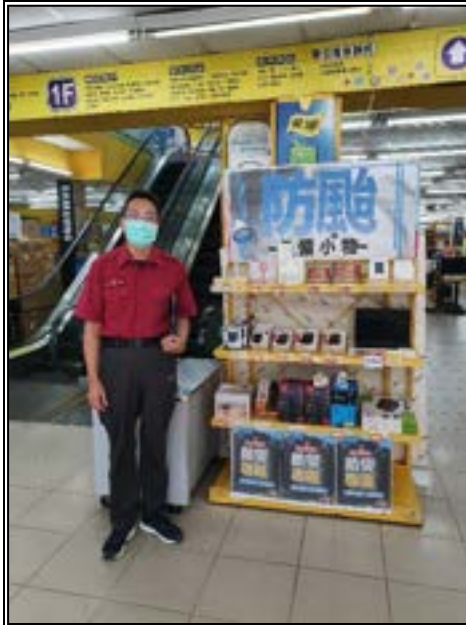
圖 5、賣場專區訪視照片(防颱用品)