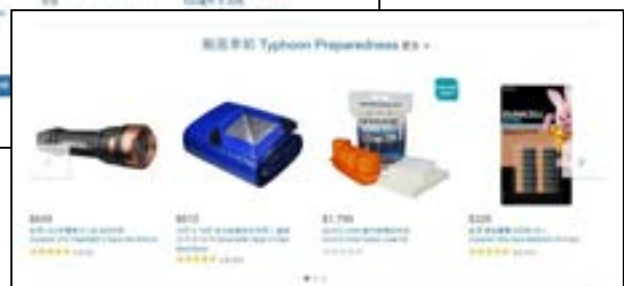
圖 43-44、產品目錄及宣導單