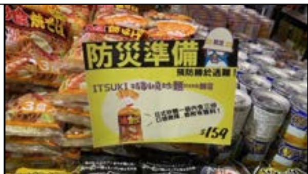
圖 10、賣場專區照片(防災儲備)