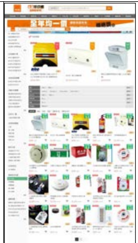
圖 42、產品目錄及宣導單