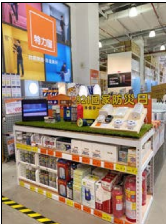
圖 18、賣場專區(921 國家防災日)