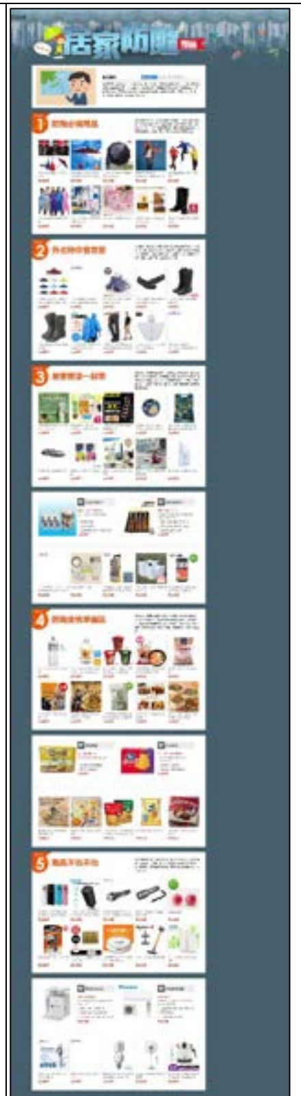
圖 32、產品目錄及宣導單

https://www.etmall.com.tw/topic/%E9%A2%B1%E9%A2%A8%E5%B0%88%E6%A1%88?gclid=CjwKCAiA1e0eBhBdEiwAfgmXf_CenvL4RSw9r-sj46B7ss-iSEv93K82hon2ekZ1geM33nc-UJa-8xoC-bEQAvD_BwE