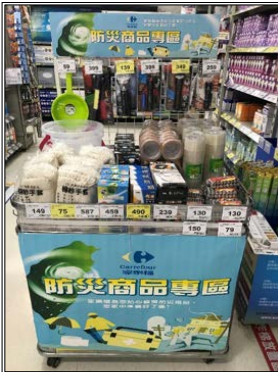
圖 11、賣場專區(防災商品)