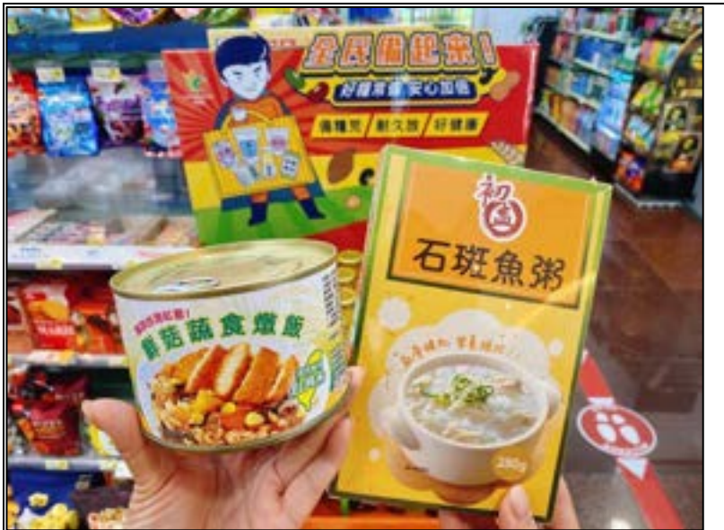
圖 17、國產農糧常備食品專區

在地食材原料使用占比高外，皆可便利即食且常溫保存半年以上，更有商品發揮創新力將燉飯包裝優化全開罐拉環設計，既能便利飽足又兼顧營養美味。