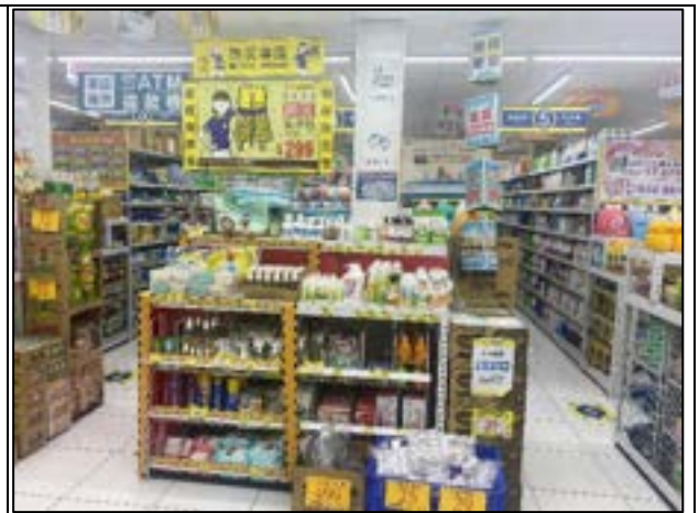
圖 23、賣場專區(防災用品)