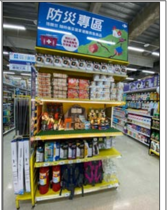
圖 25、賣場專區(防災商品)