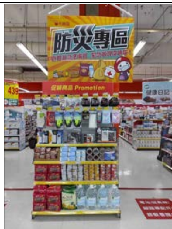
圖 21、賣場專區(防災儲備)