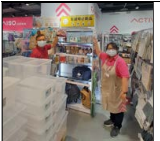
圖 7、賣場專區照片(災時必備用品)