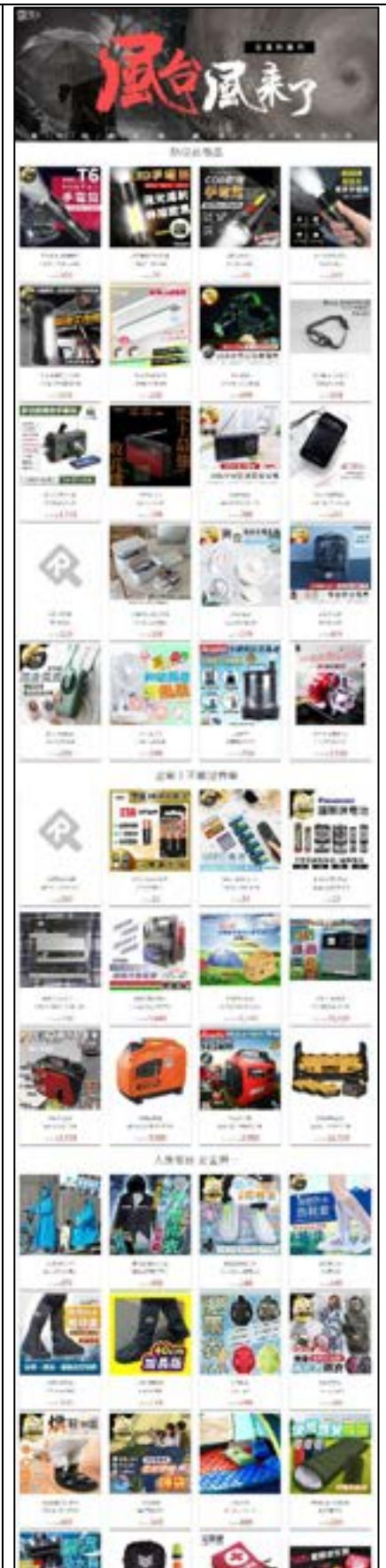
圖 38、產品目錄及宣導單