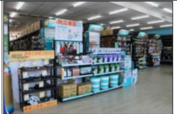
圖 27、賣場專區(防災用品)