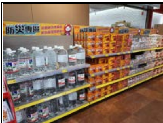
圖 20、賣場專區(防災儲備)