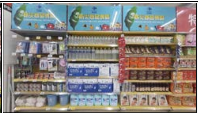
圖 12、賣場專區照片(防災儲備)