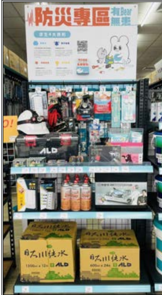
圖 26、賣場專區(防災用品)