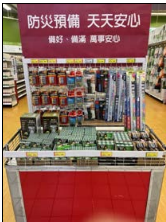
圖 19、賣場專區(防災用品)