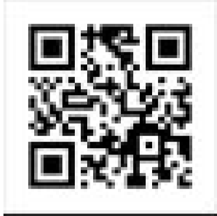
警政服務APP Android 版