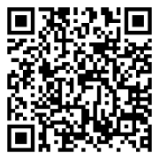
線上報名 QR code